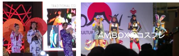
北九州市の五平太ばやしグループ、ミンダナオ国際大学、武道グループによる日本文化紹介