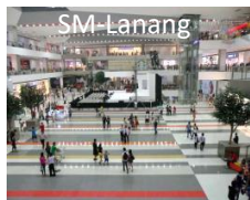
ブース・エリアのイメージ